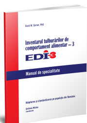
Inventarul tulburărilor de comportament alimentar-3 (EDI-3)