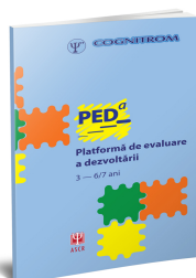
Platformă de evaluare a dezvoltării 3-6/7 ani (PEDa)