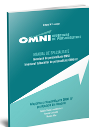
Inventarul tulburărilor de personalitate (OMNI-IV)