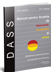
Scalele de depresie, anxietate și stres (DASS-21R)